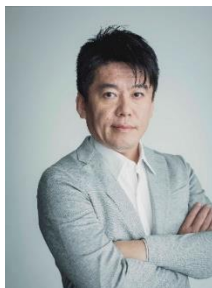
著者 堀江貴文 インターステラテクノロジズ株式会社 ファウンダー